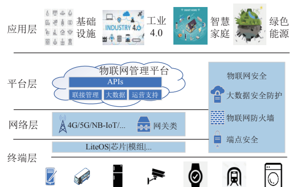
图1 物联网系统框架示意图

参考如图1所示,物联网系统框架示意图,从“感”“联”“知”“用”4个层面设计智慧林带平台。其中,“感”,即感知层,包括林带部署的智能终端设备和功能子系统硬件设备,完成对异构的设备、信道、场景、人员等感知对象,进行全场景、富媒体、精确、高效的数据感知与采集,实现场景的数据化。“联”,即网络互联层,主要通过统一标识大规模联网实体,并提供通用、安全的通信协议标准和接口规范,利用互联网、物联网、局部以太网等对应的异构网络融合技术,底层大规模异构实体与局部以太网的高效安全自适应的互联,完成异质网络上数据的实时安全传输和信息的高度共享,实现感知层异构功能系统横向的互联互通,为互相协作提供支撑。“知”,即平台层,包含数据服务、决策控制、业务等多个中台,完成对网络层汇聚的数据进行低延迟、高可靠、高效的分析与挖掘、决策以及闭环控制反馈等,打破各个功能子系统之间的“信息壁垒”,实现信息融合。“用”,即智慧应用层,基于底层硬件和平台,呈现智慧能源管理、公共安全、智慧停车等不同垂直场景的应用落地。