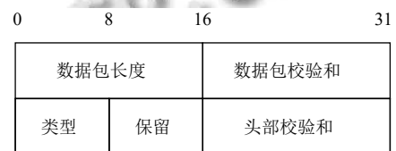
图 1 TNS 通用首部格式

TNS 报文通用首部格式如图 1 所示,共 8 个字节,包括数据包长度、数据包校验和、数据包类型、保留位、数据包头部校验和.需要注意的是,最新的 315 版本 TNS 协议中,数据包长度和校验和位置进行了对调.目前数据包校验和、保留位、数据包头部校验和均以 0 填充.数据包类型的取值与含义见表 1.其中,类型为 0x06 的是 Data 类型数据包.在连接建立完成之后,客户端的请求、服务器的响应都是 Data 类型,因此本文分析的对象主要也是该类型数据包.