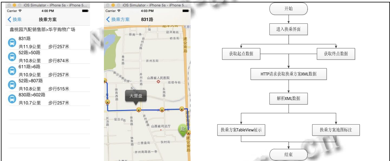
图 3 公交换乘查询功能与流程图