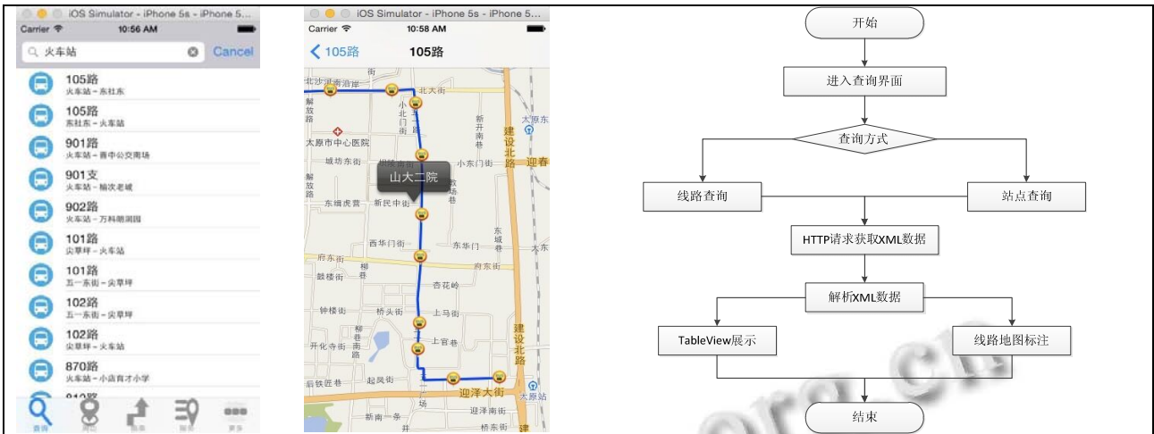
图 2 静态公交查询功能与流程图