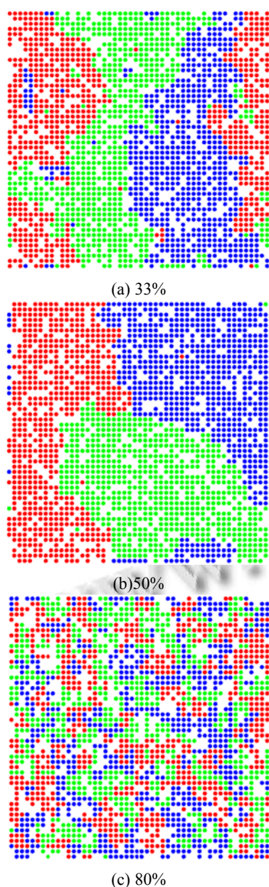
图 3 不同同类邻居期望比例下的仿真结果

地变动. 仿真结果可以解释为即便人们相对比较能容忍与不同类型的人们相处在一起, 如在 33%和 50%的同类邻居期望比例下, 还是会出现大范围的居住隔离现象. 相反, 如果人们有极端的同类邻居偏好, 如在 80%的同类邻居期望比例下, 居住隔离现象反而不容易形成. 由此, 我们可以深刻地认识到, 宏观层次上发生的居住隔离现象, 可能并不是由于在微观层次上人们对周围环境的苛刻要求造成的. 正如 Thomas C. Schelling 所阐述的: 微观上的动机并不一定等同于宏观上的表现. 仿真模型揭示了宏观隔离现象与微观行为间的关系, 达到了实验目的.