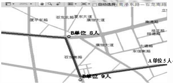
图 2 某现场警力部署图

为了便于警卫线路规划，常用线路可以重复地在多次的警卫任务中使用，当有新的警卫任务时，可以调出原来的线路，或新建线路就行警卫线路规划。警卫线路可以命名以便于管理，可以根据输入的地点名，经过搜索将地点在图上显示出来，查询警务单位的空间位置和属性信息。线路、警卫点的查询支持通过空间信息查询，也支持属性信息（例如线路名称、警卫点名称等）查询。