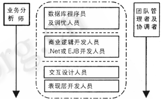
图 2 团队模型图

业务分析师和团队管理者贯穿开发过程全局。业务分析师是精通商业需求和商业流程的业务专家,他在整个开发过程中定义产品特性和边界,并随时为开发人员解答他们对业务要求的疑问。团队管理者及协调者在整个开发过程中控制开发进度、协调团队和环境的关系、安排交流以及在某些事情上做出仲裁,团队管理者可能会同时管理着几个团队。