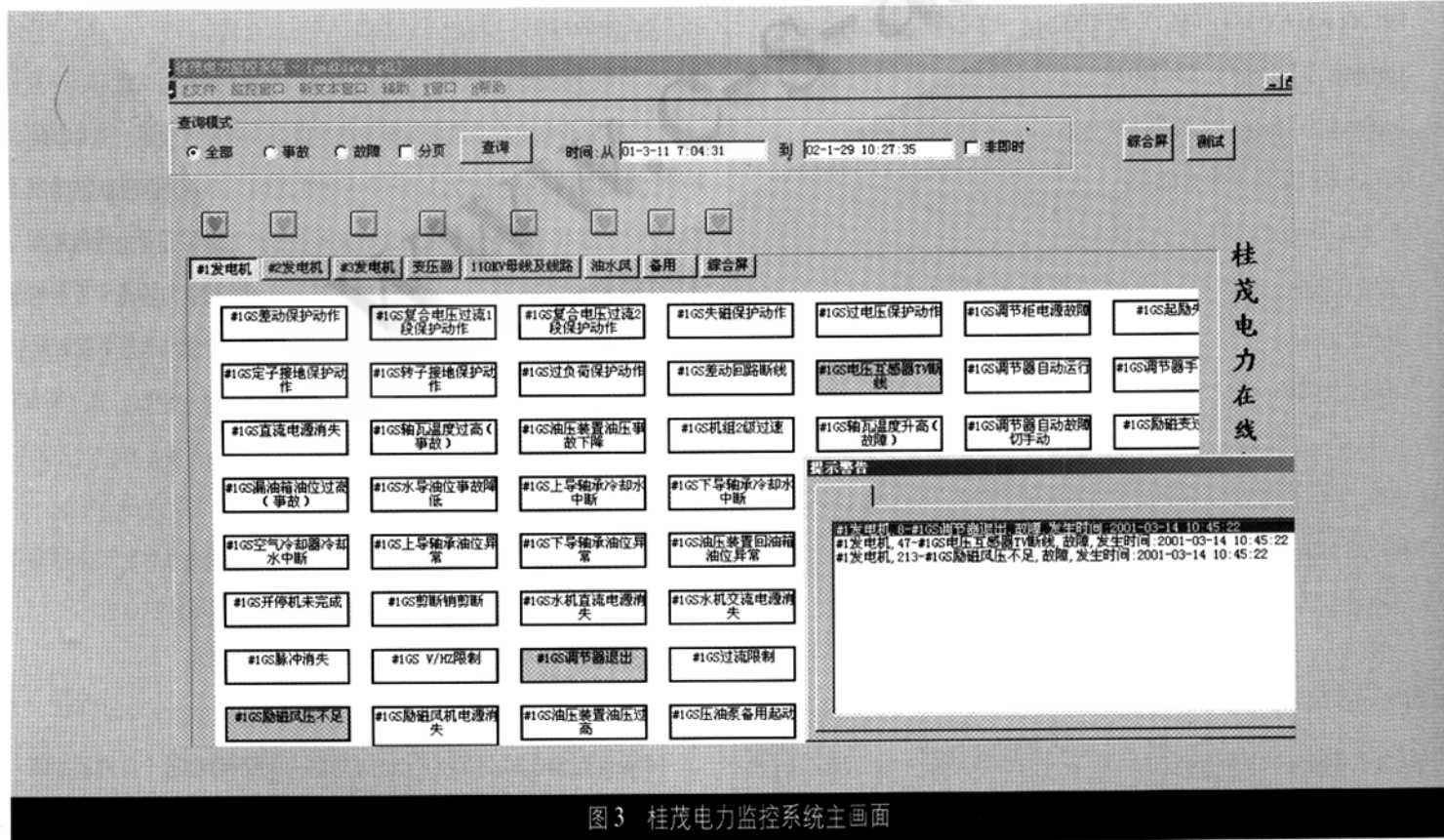
图3 桂茂电力监控系统主画面