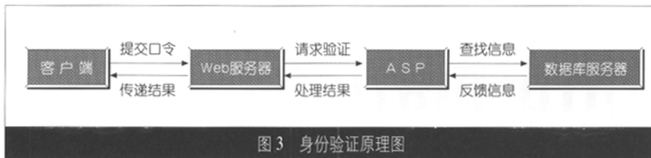
图3 身份验证原理图

考虑到开发周期以及网络传输速度等因素的影响,本方案采取了ASP+DLL的设计思路,将动态生成的报表数据与图形联系起来,得到灵活多样且美观实用的图形输出,利用会话存储报表数据流,单开图形窗口并及时释放,这样在网络中传输的就只是报表数据而已,图形在客户端生成。图形控件是作为HTML语言的Object元素对象嵌入到web页中,<object>标注中的ID参数用于标识脚本语言的对象和别的对象,而用classid将一个对象和别的对象区别开来,<object id=Chartspace1 classid=CLSID:0002E500-0000-0000-C000-000000000046 style="width:100%;height:360;" align="center"></object>,实际的应用中web浏览器能够通过给定的classid和版本号检查是否该对象已经在用户的系统中存在,当发现用户的系统未登记该控件时,就会提示用户是否下载并安装该控件。