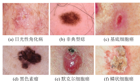
图 1 不同种类皮肤病

皮肤癌分类领域的数据集对于算法的训练和评估至关重要, 提供丰富的皮肤镜图像和相关临床注释, 其中包括日光性角化病、非典型痣、基底细胞癌、黑色素瘤、默克尔细胞癌和鳞状细胞癌, 如图 1 所示. 这些类别涵盖了从癌前病变到各种常见和罕见的皮肤癌类型, 支持皮肤癌诊断算法的研究和开发.