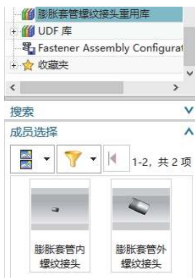
图6 膨胀套管螺纹接头重用库界面