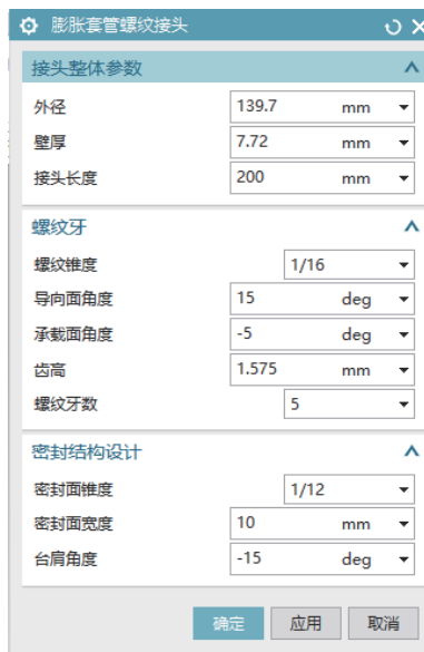
图 2 接头对话框及对话框属性

UG/Open UI Styler 是 UG 二次开发工具中的可视化编辑器, 可以制作出和 UG 软件具有相同风格的人机交互界面. 结合膨胀套管螺纹接头建模所需参数, 利用“块 UI 样式编辑器”进行编辑, 主要使用“布局”中的“组”和“编号”中的“表达式”等功能进行用户界面设计. 通过“组”block 将膨胀套管螺纹接头的参数分为接头整体参数、螺纹牙和密封结构 3 组. 再通过“表达式”block 将所需参数放在对应的分组内, 完成如图 2 所示的对话框设计. 完成膨胀套管螺纹接头用户界面设计后, 将其保存在 application 文件夹中并命名为 pengzhang_taoguan, 系统自动生成后缀为 dlx、cpp 和 hpp 的 3 个程序.