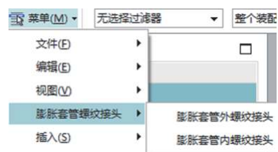
图 4 膨胀套管接头菜单

完成菜单栏编辑后, 再次启动 UG 时即可在视图菜单后面看到自定义的膨胀套管接头菜单, 如图 4 所示. 选择相应模块即可打开对应螺纹接头的对话框, 同时调用 VS 编译的链接文件, 对话框中初始数据为螺纹接头参数化建模时所使用数据, 用户根据自身需求输入所需参数, 点击确定按钮即可生成对应膨胀套管螺纹接头模型.