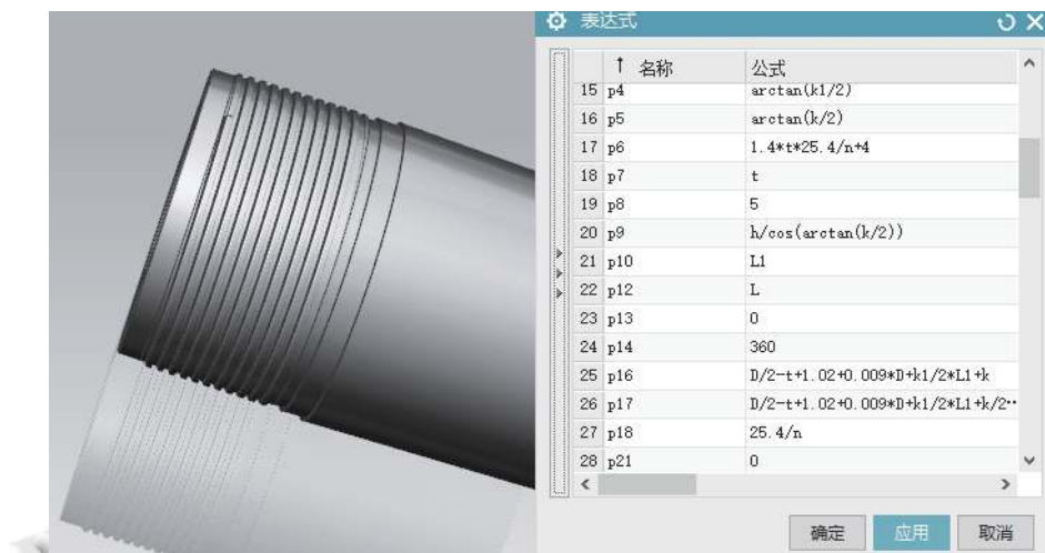
图1 基于表达式建立的膨胀套管外螺纹接头模型