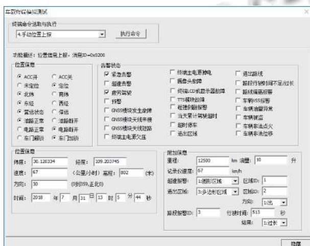
图2 模拟终端报警配置界面

使用图2所示模拟终端发送测试数据。通过模拟终端数据发送时间和Chrome开发者工具控制台日志输出时间可以计算报警延迟。每秒推送一次报警,共推送100条报警数据,从终端上传报警数据到浏览器收到报警推送的时间延迟平均值为8ms。传统AJAX轮询间隔大约是10到30s。可见报警实时性大大提高。