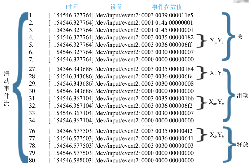
图 1 一次滑动事件流

0002 0035 000000ef 分别指事件的 type(输入事件类型), code(键码类别), value(具体数值), 这三个字段表示了坐标信息, 0035 对应于事件的 X 坐标, 具体值为 000000ef(十六进制) 对应于屏幕的坐标为 239. Android 其它复杂的事件都是由上述标准的事件流格式组合而成. 一个触摸屏手势由若干个事件构成, 形成事件流. 例如, 单个按键操作通常涉及大约 18 个触摸屏事件, 而滑动通常涉及大约 80 个触摸屏事件. 图 1 所示为一个滑动的事件流详细信息, 此次滑动一共有 80 条基本事件流, 表示该次滑动在 154 546.327 764 s 至 154 546.588 003 s 时间段完成; 1-7 行是滑动事件的开始信息, 第 4 行, 5 行分别表示滑动开始时手指所按屏幕位置的横坐标以及纵坐标. 8-75 行表示在滑动过程中持续变化的位置的坐标信息; 76-80 行表示该次滑动结束时手指释放位置的横坐标以及纵坐标.