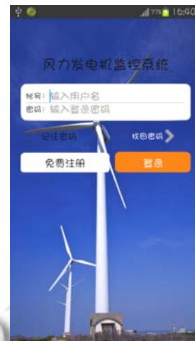
图 2 系统登陆界面

在本系统中, 客户端采用的操作系统是 Android 4.2, OPC XML-DA 服务器端通过包装 OPC DA 服务器得到。较好地实现了 Android 移动客户端与 OPC XML-DA 服务器之间的交互。经过测试, 系统稳定, 运行效率高, 能够很好地实现风力发电机的远程监控。其中, 系统登陆界面如图 2 所示, 某监控界面如图 3 所示。