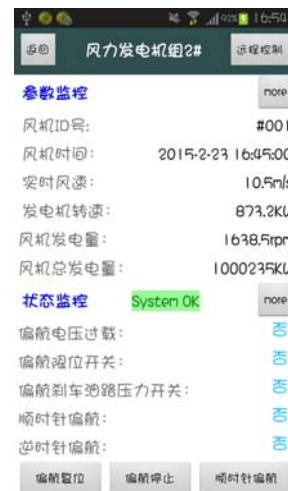
图 3 系统某监控界面