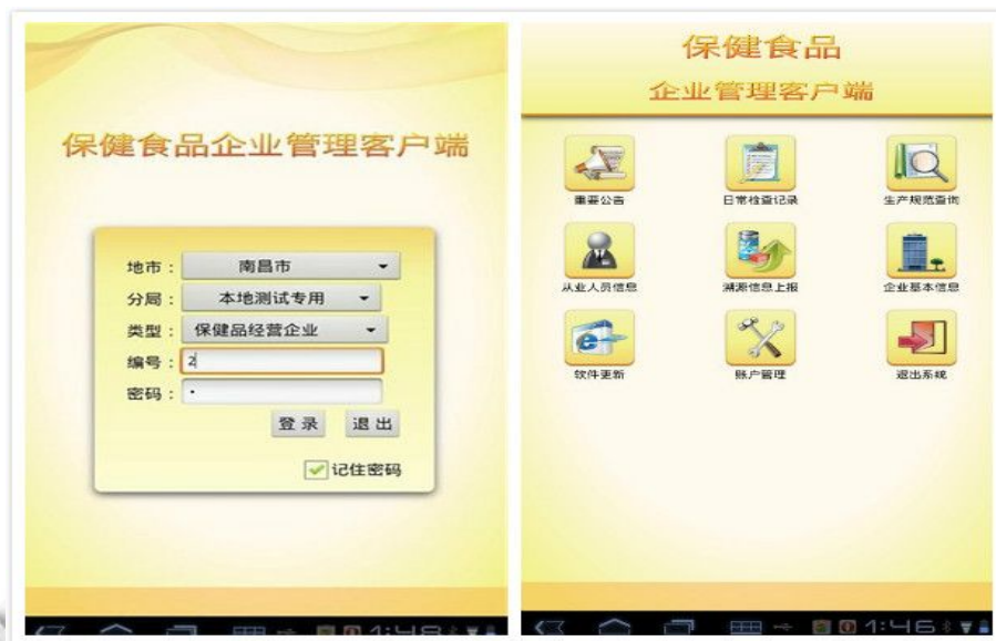
图3 用户登录及主页面

日常检查记录模块是移动监管系统的重要组成部分之一。现场检查记录包括检查记录详情、查询照片视频、现场检查信息反馈三个子菜单。通过选择页面的子菜单，逐级录入多种类型的检查信息，进行数据的交互操作，如图4所示。一个企业的检查记录包含多个相关的检查明细名称、项目内容、笔录内容和意