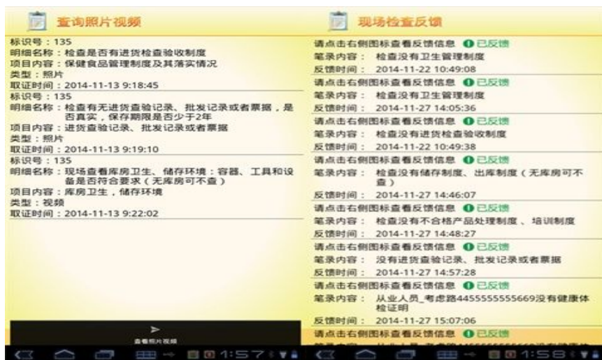
图 4 日常检查记录上传与现场信息反馈界面

溯源信息上报是保健食品企业监管的重要环节。在本系统中,对溯源信息做了详细的上报,包括品种信息、产品供应单位信息以及产品销售信息的上报,其中详尽记录了各品种信息、留样信息、电子监管码