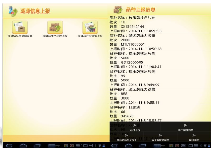
图 5 溯源信息上报界面

信息等,有效保证保健食品从生产到销售每一环节都在监管之下,达到全面性的监督功能。部分溯源信息页面如图 5 所示。