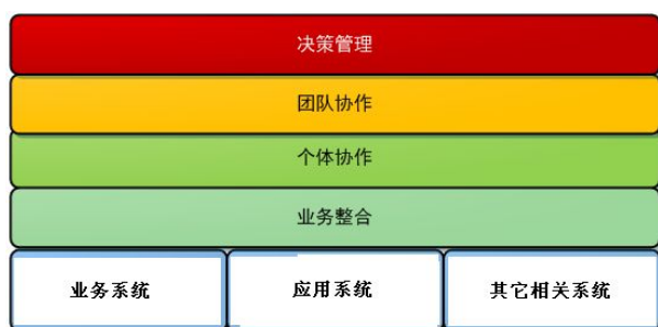
图 1 协同四层次模型图

目前较为成熟的企业协同理论模型是如图 1 所示的协同四层次理论模型 [10] , 此模型是一个金字塔结构, 处于底层的是业务整合(Business Collaboration), 业务整合之上则是个体协作(Personal Collaboration), 个体协作之上进入团队协作(Team Collaboration), 经过以上三层次的协同后企业协同才进入决策管理协同(Management Collaboration)。