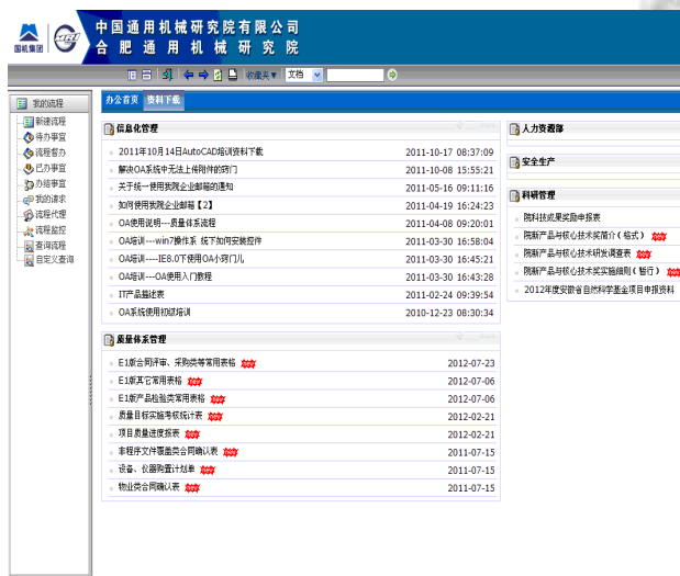
图 3 基于 BPM 的协同办公系统软件界面

基于业务流程管理的现代企业协同办公系统从企业信息化成熟度来看可以达到管理优化级或战略支持级阶段, 即企业有统一、集成的数据中心和知识共享平台, 基本体现了决策分析支持系统的功能, 要想到达持续改善级, 稳步推进企业核心竞争力的发展, 建立一个真正意义上的数字化企业还需要一个较长的过程, 基于业务流程管理的现代企业协同办公系统软件界面见图 3 所示.