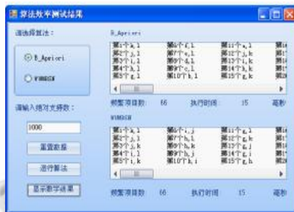
图 1 B_Apriori 和 WUMBSN 的实验结果

B_Apriori 和 WUMBSN 算法的实验结果如图 1，B_ARDSM 和 WUMBSN 算法的实验结果如图 2。运行时间随支持度和长度变化的比较如图 3 和 4 所示。从比较结果可知，WUMBSN 算法的挖掘效率比现有算法要高效得多。