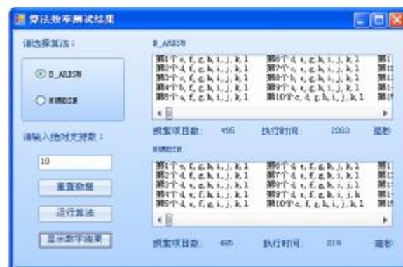
图 2 B_ARDSM 和 WUMBSN 的实验结果