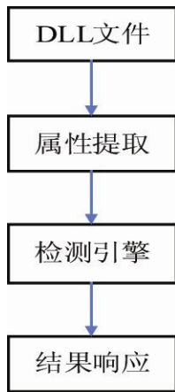
图 3 检测系统结构图