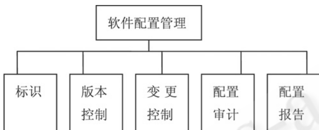
图 1 配置管理的任务