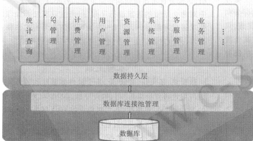
图 1 VSMP 系统架构图

③ 对一个业务的一个表进行两次统计查询 (两次统计查询只是条件不同)。需要提供两个接入点对同