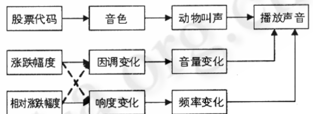
图 2 股票数据的映射方案

如图2所示,本映射模型采用了结构化离散信息映射模型,把不同的股票代码映射到不同的音色,股票的涨跌幅度和相对涨跌幅度可通过音色的音调变化和响度变化来反映。