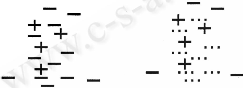
图 1 SadaBoost 的基本思想

(3) 更新 D_t 为: D_{t+1}(k) = \frac{D_t(k) \exp(-\alpha_t y_k h_t(x_k))}{Z_t} , 其中 Z_t 为归一化因子, Z_t = \sum_k D_t(k) \exp(-\alpha_t y_k h_t(x_k)) 。