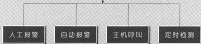
图 2 监控器中智能诊断模块

人工报警、故障信号的检测,并执行相应动作。监控器处于休眠状态时,应不断检测有无报警信号和呼叫信号,一旦有以上两种信号产生,即进行响应,并执行相应处理子程序。