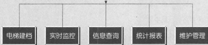
图 3 控制中心监控管理模块