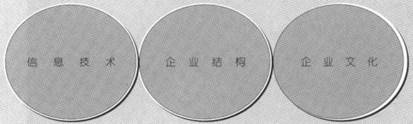
图 1 信息技术与企业文化、企业结构

(2) 企业的决策者在选择技术资源时，要着眼于企业未来的发展定位。决策者要从企业自身的经营或服务战略出发，评判技术的可行性、可靠性和实用性，寻求企业的利益最大化，技术的应用要和管理实务相适应，要为企业的未来的经营战略的需要提供支持，但企业的结构、业务流程和企业文化对技术的适应能力将直接影响信息化的开发、实施、应用。分析显示，工厂