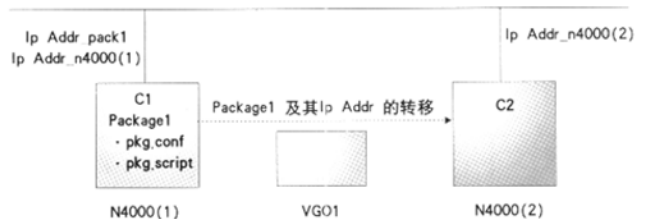
图 3 MC/ServiceGuard 集群中及包

在图 1 所示的计费系统中, 我们将三个应用进程 comm、sort 和 input 配置在同一个包 Package1 中, 即包 Package1 中包含有三个应用, 该包使用 pkg.conf 和 pkg.cntl 两个文件先在 N4000(1) 主机上运行。由于卷组 VG01 中含有 Package1 中的应用所需要的数据, 所以, VG01 挂在 N4000(1) 主机上。N4000(1) 主机的网卡 c1 有两个 IP 地址, 一个是其本身的 IP 地址 193.2.1.1, 子网掩码: 255.255.255.0, 另一个是 Package1 的 IP 地址 193.2.1.3, 子网掩码: 255.255.255.0, 如图 3 所示。