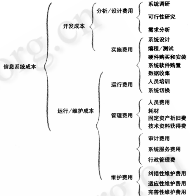
图2 信息系统的成本构成(引自参考文献[5])

从上图可以看出,信息系统的成本主要分三大类:硬件成本、软件成本和其他费用。其中硬件成本可以从市场价格粗略估算,其他费用可以根据历史资料加以预测。比较难估算的是软件开发成本,国内外文献已提供了多种估算它的数学模型,主要有COCOMO模型、Halstead模型、FPA模型等。