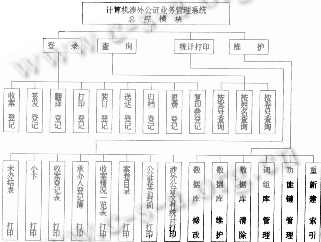
图 2 《计算机涉外公证业务管理系统》功能模块结构框图