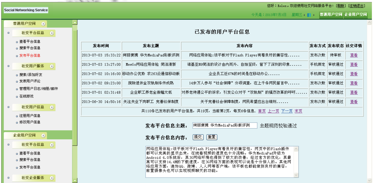
图 3 用户发布信息用例的平台实现页面

用户所发布的平台信息是社交网络服务中最重要的资源之一，通过该资源，用户可了解到网络应用服务的推荐体验，可发表对该资源的个性评论，可模糊检索发布相似资源的用户，并申请添加其为好友；将该资源作为联系的纽带，可搭建起企业与企业之间双向的供需关系；将该资源作为共同的话题，可搭建用户之间的社交关系。因此，用户发布平台信息是社交网络前台组件中的一个重要用例，本节将主要阐述如何通过基于 Struts2 技术的页面设计、业务逻辑处理和逻辑设计过程，完成该用例的原型实现，如图 3 所示。