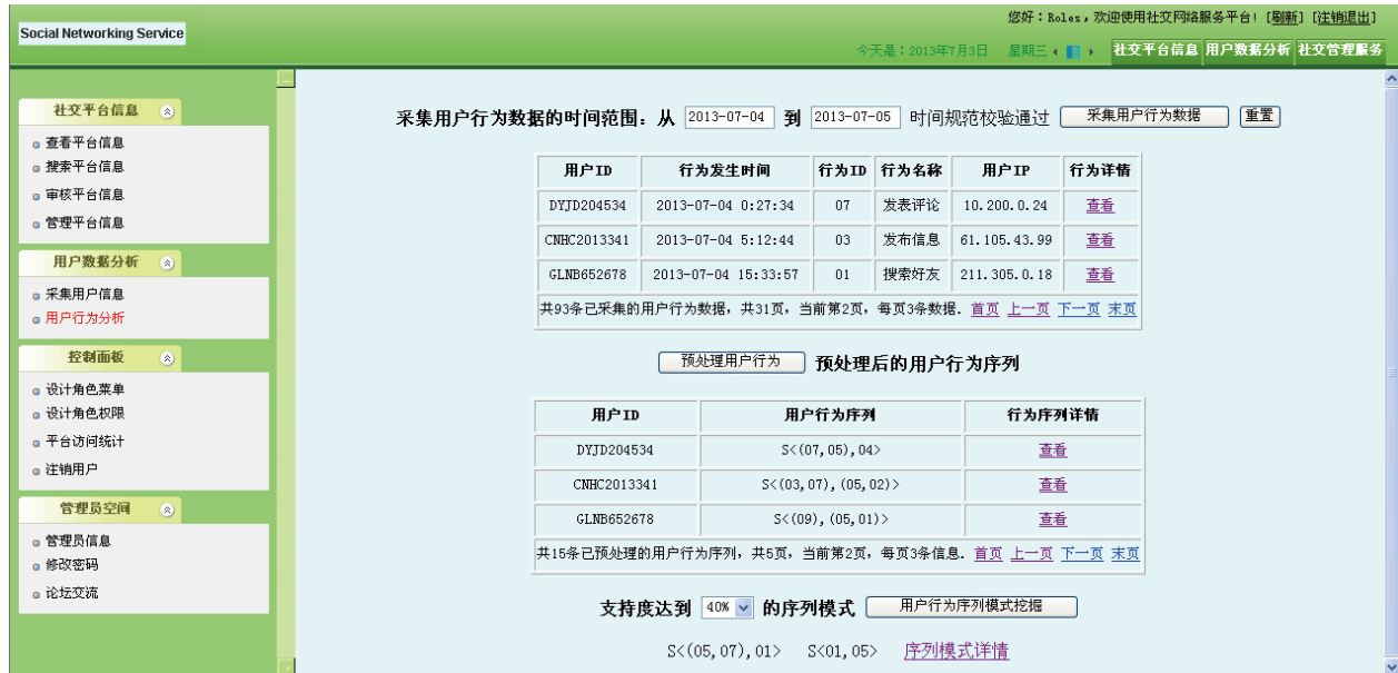
图 4 网站管理员分析用户行为序列用例的平台实现页面

网络后台组件中的一个重要用例, 本节将主要阐述如何通过基于 Struts2 技术的页面设计、业务逻辑处理和控制逻辑设计过程, 完成该用例的原型实现, 如图 4 所示.