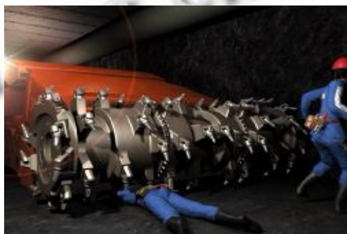
图 4 效果图

连采工作面中，连采机在煤壁上切割操作，检修人员检修连采机，发现连采机的截齿需要更换。检修人员更换截齿时。检修人员进行违规操作，没有切断连采机的电源，出现连采机把人卷入的事故。员工进入培训系统，选择连采工作面，选择连采机检修。其中，有两项是关于连采机检修的。连采机没有断电引起的后果，连采机没有闭锁引起的后果。员工控制检修人员的虚拟人，到连采机前检修，更换截齿。连采机突然转动，把检修人员卷入连采机中。事故发生后的效果图 4 所示：