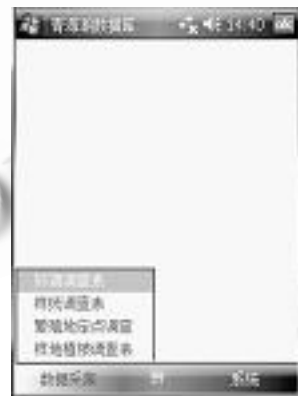
图 8 PDA 采集页面

如果数据采集表格发生变化, 可能需要新添字段、或者删除字段、或者新增表格, 只要稍微进行定制操作, 重新拷贝 XML 文件就可以获得更新后的 PDA 数据采集页面, 而无需涉及程序的修改, 使得整个应用系统具有很好的扩展性。