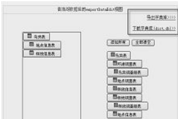
图 7 导出字典表

已获取的数据库元数据信息基础上, 提供用户选择字典表的界面, 将这些字典表的数据导出成 SQLite 数据库文件, 如图 7 所示。同样采用 Web 方式, 用户将从 PDA 上拷贝出来的 SQLite 数据库文件上传到网站上, 点击导出按钮即将 SQLite 数据文件中的记录一条条插入到后台数据库中(其中, 要主键外键的更新一致问题)。