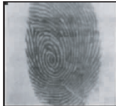
图 1 采集的指纹源图像

下图分别为用方向图法、方差法、角部灰度均值法和本文提出的新的复合法对指纹图像进行图像分割后的不同效果图。