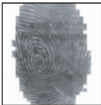
图 5 复合法分割效果图

通过实验发现,方向图法在绝大多数情况下都很有效,但当图像中方向信息不能准确提取时,则会失去作用;灰度方差法对于高对比度图像有较好的效果,但对于低对比度或增强后的图像则不适用;角部灰度均值法分割较为准确,而且处理速度很快。复合法结合了方向图和角部灰度均值两种方法的优点,可以快速有效地对指纹图像分割,与人的视觉分割要求接近,具有较强的稳定性和较高的分割正确率。