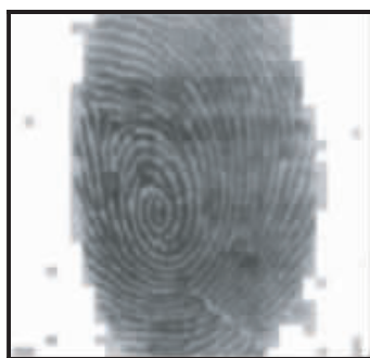
图 4 角部灰度均值法分割效果图