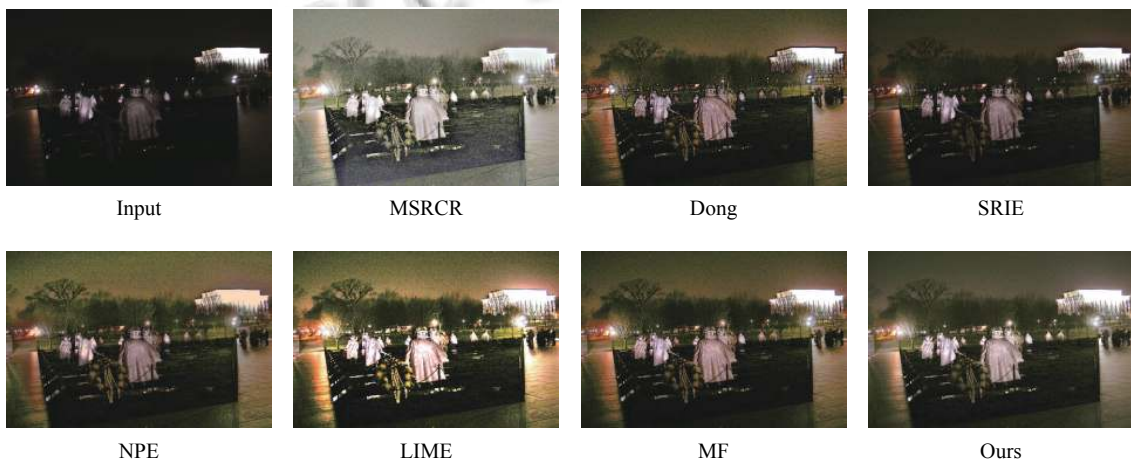
图 4 Plaza 增强对比实验结果