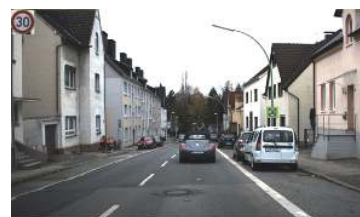
本文方法算法提取结果