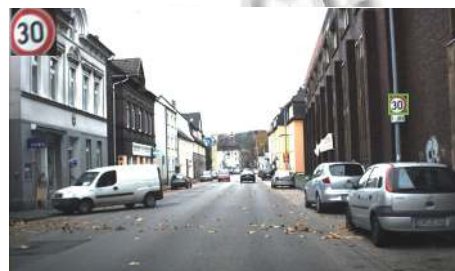
图5 检测目标变形的提取结果