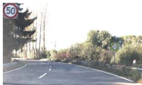
图4 背景曝光过度且图像模糊的提取结果

本文给出了针对红色圆形交通限速或者禁止标志的分割和定位方法. 分割方法采用 K-means 聚类算法进行初步图像颜色分割, 其分割方法同样适用于蓝色、黄色等其他颜色的标志分割; 标志图像定位采用 Hough 变换检测方法针对圆形交通标志检测定位, 该方法同样可以适用于矩形和三角形标志的定位. 本文方法能针对强烈光照、图像模糊、背景和标志颜色相近等复杂背景下的交通标志检测, 但是提取方法未考虑多幅标志存在于同一图像、浓雾、雪天等情况. 考虑上述因素是提高交通标志检测实时性和有效性的未来研究方向.