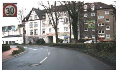
图6 检测目标污染的提取结果