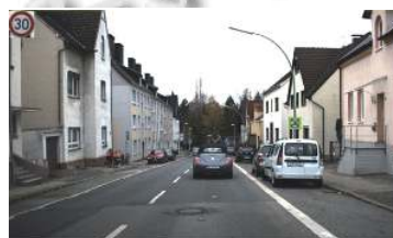
未改进 Hough 检测提取结果