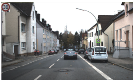
图3 背景与目标颜色相近的提取结果