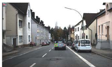
经典的 RGB 分割方法提取结果