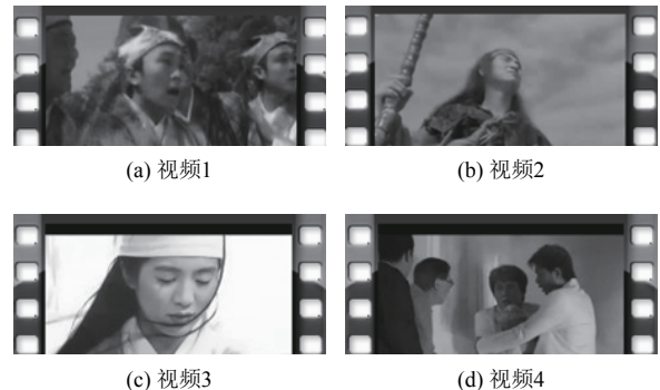
图1 拟诱发不同情绪的视频示例