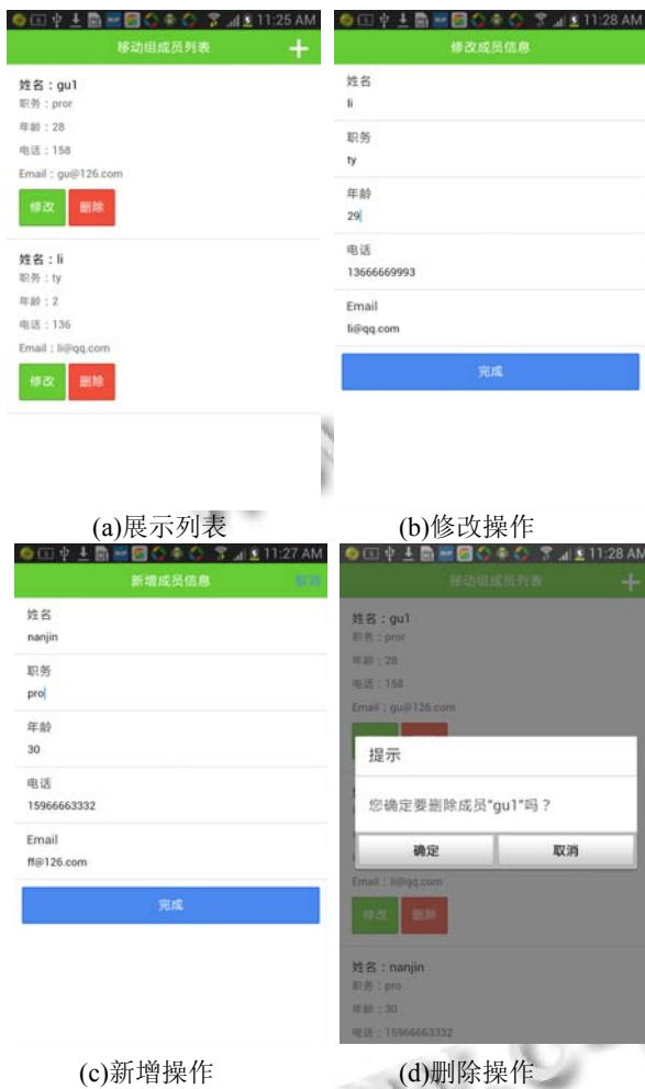
图 4 一键真机调试结果

据调查可知,不用创新开发的 eclipse 创建 html5 混合开发项目工程和开发后进行的调试约为 30 分钟,而利用新开发的 eclipse 插件创建和调试运行 html5 时