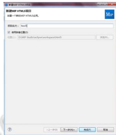
(a) 新建 html5 项目

搭建一套基于 html5 的开发环境会花费很长时间, 这样会影响整个移动信息技术的开发的效率, 所以进行基于 eclipse 的二次开发, 把 html5 所需的 jar 包等全部包含于 eclipse 中新建 html5 项目. 同时, 进行了基于移动应用平台的开发的 eclipse 集成, 新建的 html5 项目也是基于移动应用平台(MIP)的. 如图 2 所示, 通过 eclipse 插件开发 html5 集成, 两个步骤就可以创建基于 MIP 的 html5 工程, 还提供了空白、选项卡和侧边栏三种可选择的 html5 模板, 减少了搭建开发 html5 环境的时间, 提高了开发效率.