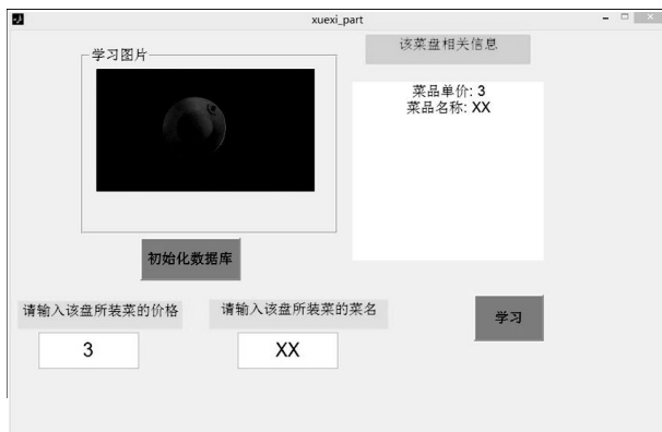
图 5 训练界面

为了能够通过识别菜盘特征以达到识别不同食物的过程,在实际应用中,对每一个盘子分配一种菜品,每种菜品与每种类型的盘子之间一一对应,首先选择菜品,放入托盘中,令托盘置于识别摄像头下,图象发送至计算机,通过本方案配套的软件识别出餐盘的种类以及数量,进而识别出所消费的菜品种类以及数量,通过查询内置菜品对应价目表,自动累加得到总价,该价格显示在液晶屏幕上,若消费者对价格无异议,便可刷卡通过.