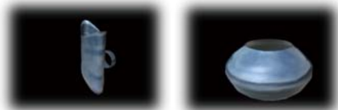
图 5 Squash 变形图 图 6 Flare 变形图