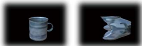
图 1 原始图 图 2 Wave 变形图