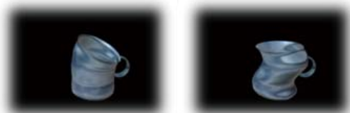
图 3 Bend 变形图 图 4 Sine 变形图