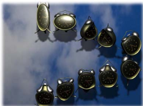
图 9 实例结果图

最后,接收上层信息调用 MAYA API 生成一段 MA 片段并渲染得到一个动画.效果图如图 9 所示: