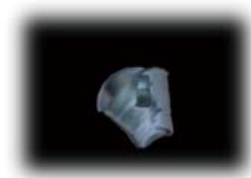
图 7 Twist 变形图