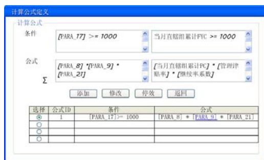
图 3 计算公式定义

后,即可通过计算公式定义页面,为佣金项定义相应的计算公式,公式由已定义的佣金参数、常数、算术运算符等组成,在设置不同条件的情况下,可以为同一个佣金项目定义不同的计算公式,从而有效提高系统的灵活性和实用性。公式定义接口如图 3 所示: