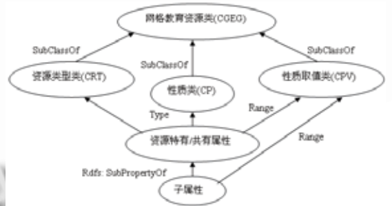
图 3 教育资源 RDF Schema 层次模型

RDF 预定义的词汇表只能提供由 Resources，Properties 和 Statements 三种对象组成的基本模型。在进行资源描述时这些词汇是远不够用的。为此 RDF 定义了标准 Schema，在其中规定了描述类、属性及其语义的机制，使用户可以定制 RDF 词汇表。有了这些词汇表就可以对各种资源进行 RDF 描述 [5] 。