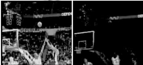
图 2 NBA 比赛视频

从表 1 中可以看出，查全率和查准率都超过了 80%，这说明了基于 HSV 颜色空间模型的场景切分算法取得了很不错的效果。对于不同的 AVI 视频文件，查全率和查准率可能会相差比较大，原因就是阈值 m 的取值影响了场景切分的准确性与完全性。