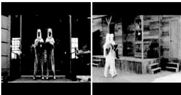
图 3 生化危机视频截图

图 2 的两幅图像是 NBA 球赛视频中相邻的两帧，而在本实验中被切分在不同的子视频里。图 3 的两帧图像在《生化危机》视频中属于不同的场景，却没有被切分出来。出现这样的情况就是因为 m 的取值造成的。进一步实验证明，当 m=0.7 的时候，图 3 中的两帧图像就被切分到了不同的子视频中。