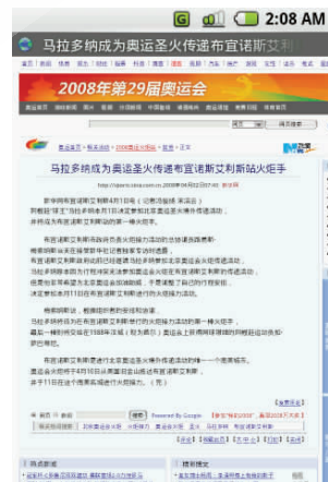
图 4 内容显示在手机浏览器中