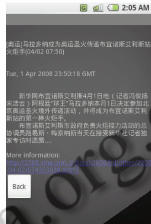
图 3 内容摘要