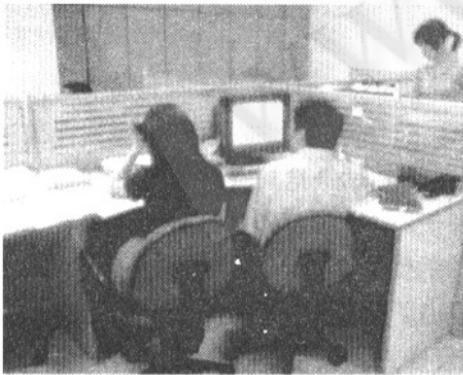
图2 自发结对的系统分析员

在进行数据库设计时,两个分析员也自发结对进行设计,在一台计算机前研究(如图2所示),这个临时结对一直持续到数据库设计、实施结束。