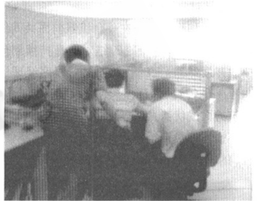
图 3 三人结对编程

结对不仅限于 2 人结对。可以 3 人、4 人结对。这适合解决重要的技术问题或项目时间要求非常紧张的情况。这时,可以由系统分析员、程序员和用户根据需要组合在一起。如图 3 所示。