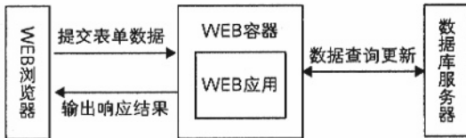
图 1 J2EE 平台下 WEB 应用输入输出流

随着全球经济的一体化成为一种主流趋势,如今的企业已经不再仅仅着眼于本国市场,而是开始致力于在全球范围内为产品寻找客户。Internet 的迅猛发展推动了跨国业务的发展,它成为一种在全世界范围内发布产品信息、吸引客户的有效手段。为了使企业 WEB 应用能够支持全球客户,软件开发者应该开发出支持多国语言、国际化的 WEB 应用。