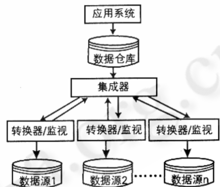
图 1 数据仓库体系结构

转换器在进行信息转换时面临的主要问题是如何将半结构化的数据转换成结构化的信息。由于转换器是对应于数据源的,而如此庞大的 Web 数据源使得人工构造转换器的代价太大,因此需要有快速建造并自支维护转换器的工具,而目前这类工具不多且很不完善,因为在多数据源信息集成系统上的应用层中,用户提交查询后才能进行训练,在响应速度和处理效率上令人难以忍受,不是很实用。近年来 XML 及其相关技术的迅速发展,为多数数据源信息集成系统中对半结构化数据的处理提供了解决的方法。