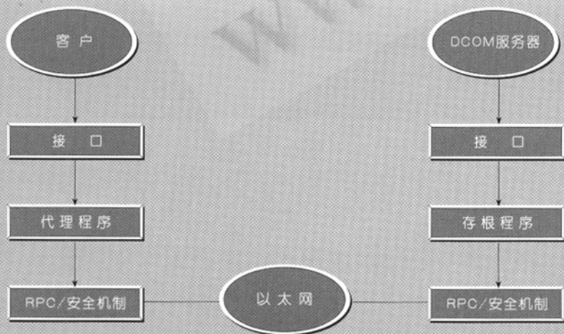
图1 DCOM 网络结构图

当客户进程和组件位于不同的机器时,DCOM 仅仅是用网络协议代替了本地进程间的通信,客户和组件都不知道连接它们之间的距离增大了,DCOM 建立了一种代理占位机制来实现不同机器上客户与组件间的通信,客户通过接口调用来访问代理服务器,然后代理服务器再与 RPC (远程过程调用)通信,RPC 使用底层网络协议(如 TCP/IP 等)来实现远程通信,在服务器端 RPC 与存根程序对话,然后存根程序再通过接口调用访问服务器 [2] ,DCOM 的网络体系结构如图 1。