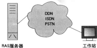
图 1 远程访问连接示意图

建立远程连接依赖于 Windows NT 提供的 RAS 服务, 它的本意即为 Remote Access Service。远程连接可以通过 DDN 专线、ISDN 或 PSTN 等方式连接实现, 如图 1 所示。为方便, 在本文中, 把提供 RAS 服务的 NT 服务器叫 RAS 服务器。对一般单位, 由于工作站和服务器的数据流量不是很大, 也不是实时连续访问, 可以用普通的电话线通过 MODEM 拨号进入服务器, 实现远程登录和数据的访问。