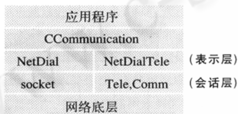
图 3 网络通信类库示意图