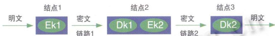
Ek1及Ek2为加密变换, Dk1及Dk2为解密变换

面向链路的加密方式将网络看作由链路连接的结点集合, 每一个链路被独立的加密。它用于保护通信结点间传输的数据。每一个链接相当于OSI参考模型建立在物理层之上的链路层。链路加密方式如图3所示: