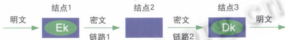
Ek为加密变换, Dk为解密变换

端对端加密方式建立在OSI参考模型的网络层和传输层。这种方法要求传送的数据从源端到目的端一直保持密文状态, 任何通信链路的错误不会影响整体数据的安全性。端对端加密方式如图4所示: