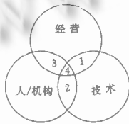
图 2 CIMS 组成三要素

企业面对激烈的国际竞争市场,不仅要技术上解决应变能力,还必须涉及经营、体制及人等重要因素。图 2 表达了 CIMS 组成的三要素—人/机构、经营与技术。在三要素的相交部门需解决四类集成问题。