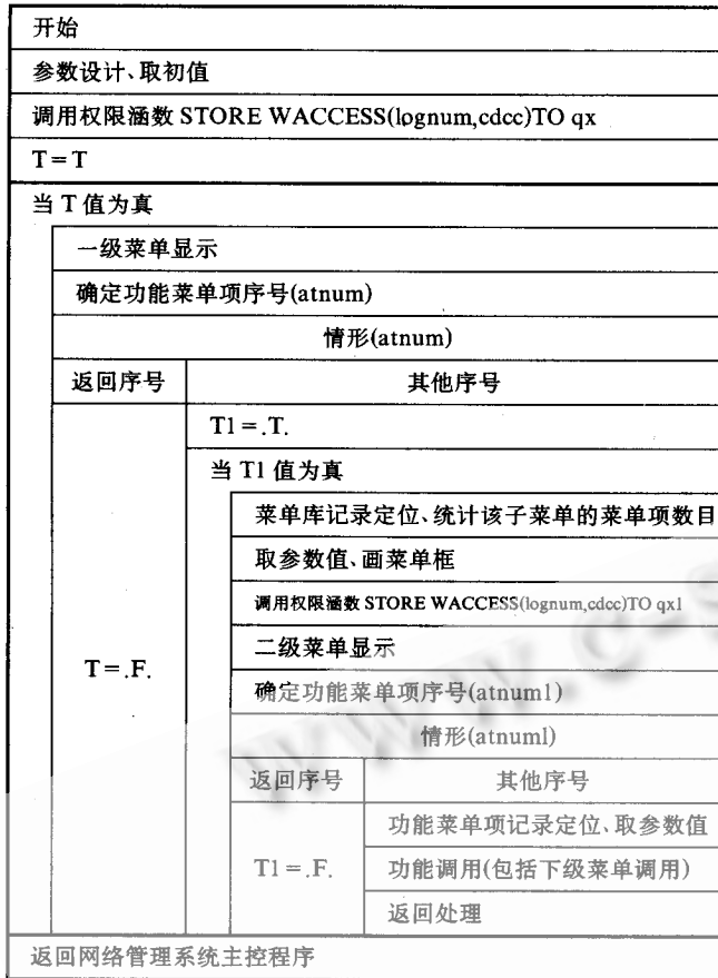
图 1 通用菜单程序流程图